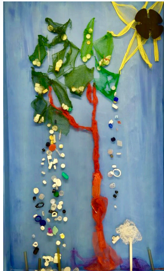
Claire Desjardins Immersion, panneau no 1, 2023 Objets de plastique récupérés, acrylique sur loanne, 213cm x 122cm