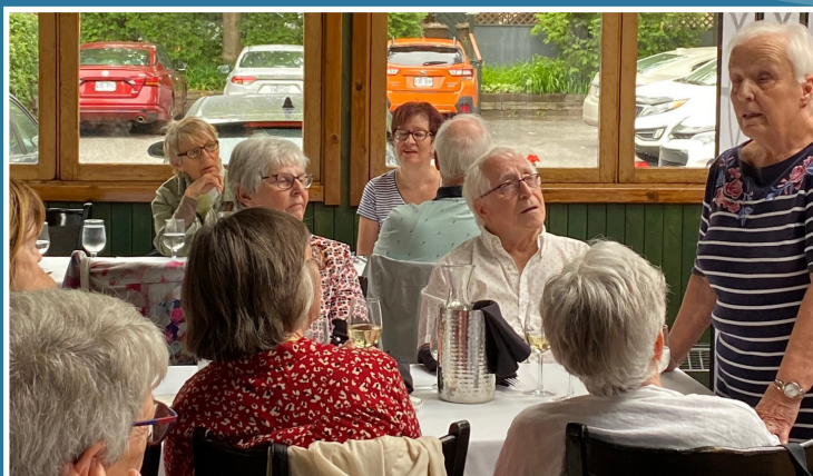
Mot de bienvenue