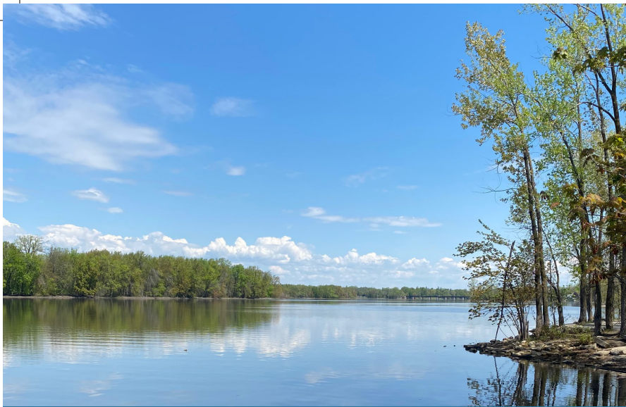
Jacinthe Joncas, Rivière des Mille-Îles