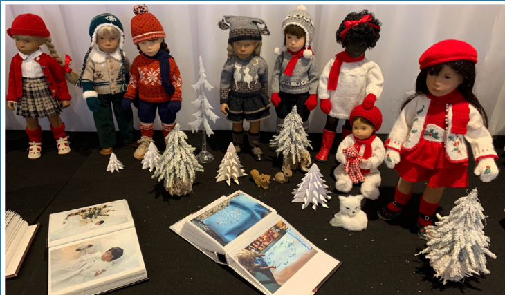
Collection de poupées Christine Durand

Port payé Postage paid Poste Publications Publications Mail 41350019