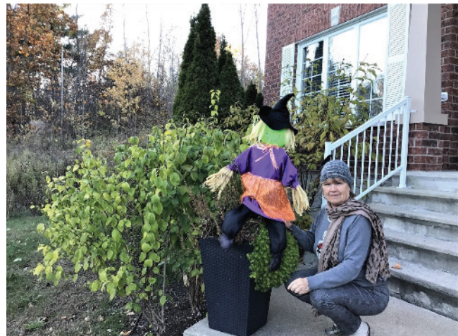
Photo prise à l'Halloween chez moi. Les arbustes sont encore verts, mais pas la présidente.